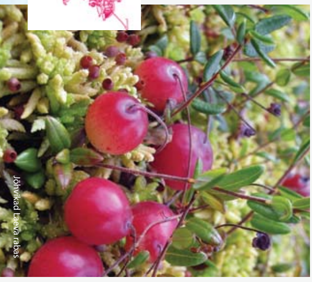
Jõhvikad Laeva rabas