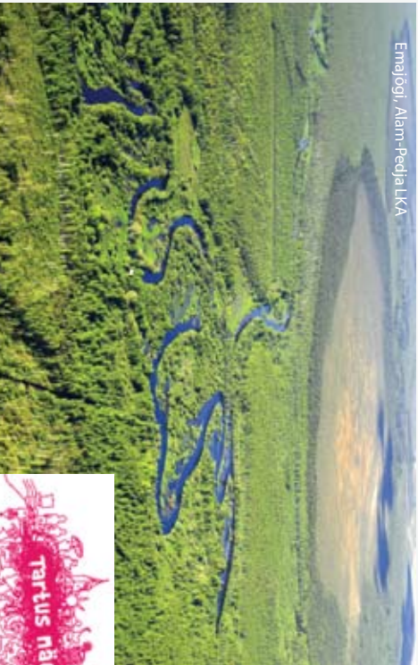
Emajõgi, Alam-Pedja LKA