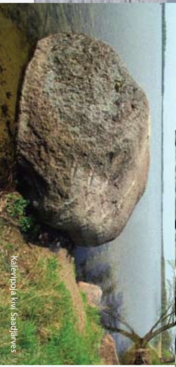
Kalviopõie kivi Saadjärves