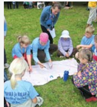
Unipiha mängud - lapsed oma lippu maalimas

Turismiinfopunkt ja Rannu valla muuseum E-R 8-16. Rannu, Tel 528 6785